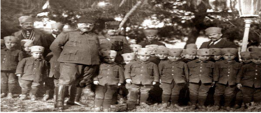
Fotoğraf 14. Kazım Karabekir'in Çocuklar Ordusu Teşkilatı'nın çocukları ile Ali Hikmet Paşa

1933 yılında Ulu önder Gazi Mustafa Kemal Atatürk'ten aldığı talimat doğrultusunda Balıkesir esnafı ile birlikte yoksulları Gözetleme Cemiyetinin kurulmasına öncülük etmiştir ve başkanlığını yapmıştır. Cemiyetin görevi, savaşlarda babaları şehit düşen çocukları gözetlemek ve onları yetiştirmektir. Cemiyet birçok başarılı talebe yetiştirmiştir. Yetim çocukların kaldığı bina, şu anda Ulus Sokaktaki Balıkesir Fotoğraf Sanatçıları Derneği'nin (BASAF) bulunduğu, restore edilmiş olan taş binadır. Şu anda alt katı sergi salonu, üst katı ise fotoğraf müzesi olarak kullanılmaktadır (Oymak, 2014, s.10).