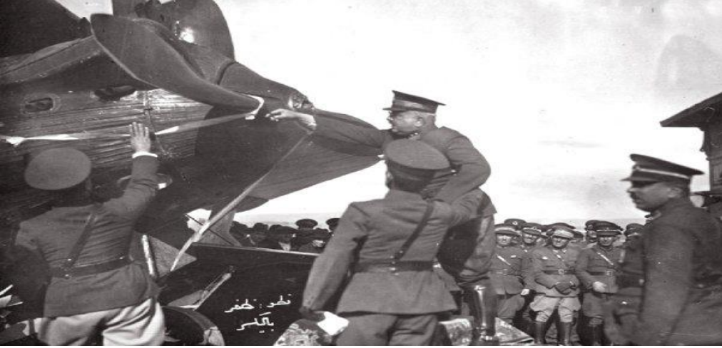
Fotoğraf 15. Balıkesir Komutanı Ali Hikmet Paşa Tayyarenin Kurdelesini Keserken

1929 yılında 2.defa yapılan yardım kampanyası ile Balıkesir halkı Balıkesir -2 tayyaresi Breguet Bre.19.A2/B2/7.A2/7.B2 alarak valimiz Sayın Salim Özdemir Günday ve askeri erkânın katılımı ile THK'na büyük bir törenle teslim etmişlerdir. (Oymak, 2012, Web 2)