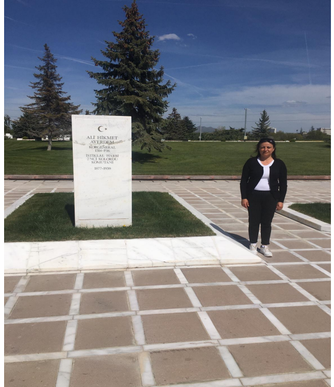
Fotoğraf 5. Korgeneral Ali Hikmet Ayerdem'in Ankara Devlet Mezarlığı'ndaki Mezarı