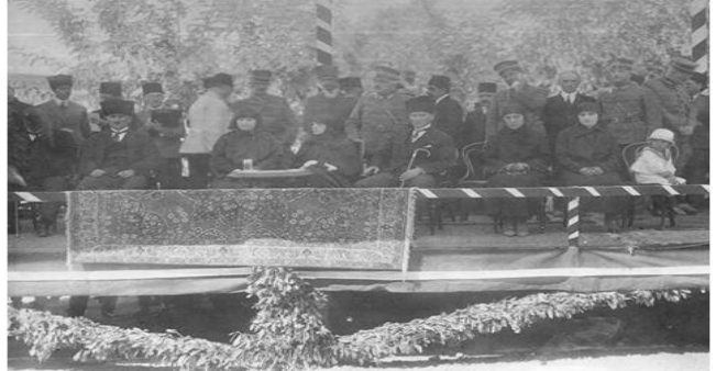
Fotoğraf 18. Ali Hikmet Paşa, Atatürk ve Latife Hanım Kent Meydanında

Ali Hikmet Paşa, çok sevdiği dostu ve yeni evli çifte sürpriz bir düğün yemeği tertip etmiş ve Balıkesir Askeri Mahfelide gerçekleştirilen ziyafet için son derece orijinal bir davetiye hazırlatmıştır. Davetiye elde suluboya ile yapılmıştır. Mönünün üzerindeki suluboya çizimler askerlerin düğün sahnesini ve gelinleri konu edinmiştir, Ali Hikmet Paşa konuklarına şehriye çorbası, balık mayonezli, hindi rostosu pilavlı salçalı kuşkonmaz, nemse böreği ve tatlı olarak da krem ranorse ikram etmiştir. Geç vakte kadar süren, müzikli düğün yemeği çok hoş geçmiştir. Yemeğin sonunda geceye katılan konuklar bu ilginç düğün davetiyesini imzalayarak geceyi ölümsüzleştirmişlerdir.