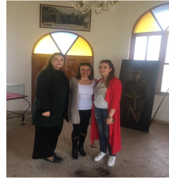
Fotoğraf 23. Ali Hikmet Paşa Köşkü’ nün Günümüzdeki Durumundan Kareler