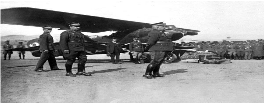
Fotoğraf 16. Balıkesir Halkı Tarafından THK'ya bağışlanan Balıkesir Uçağının Devir Teslim Töreninde